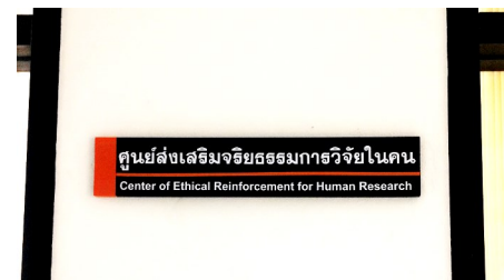
MU Center of Ethical Reinforcement for Human Research

ตั้งแต่เดือนกันยายน 2560 เพื่อการจัดตั้งหน่วยงาน ใหม่ที่ผู้บริหารเสนอชื่อว่า “ศูนย์ธำรงจรรยาบรรณและ จริยธรรมการวิจัยแห่งมหาวิทยาลัยมหิดล” (Office of Research Integrity and Compliance –ORIC, MU) ซึ่งครอบคลุมงานของศูนย์ส่งเสริมจริยธรรมการ วิจัยในคนที่ได้รับการแต่งตั้งมาเมื่อ พ.ศ. 2554